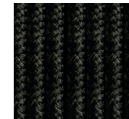
CUERDA BLACK GREY 6MM-10MM.